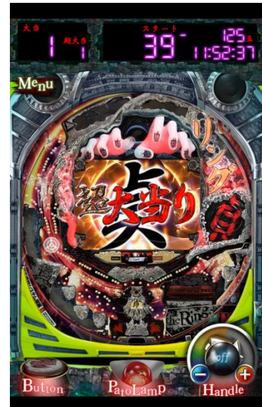
▲映画「リング」のスタッフが結集して作り上げた演出では、ホラー映画さながらの恐怖をお楽しみいただけます。

*「Android」「Google Play」は Google Inc.の商標または登録商標です。