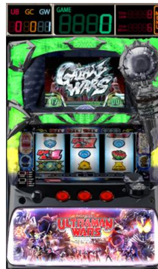
ギャラクシーウォーズ画面