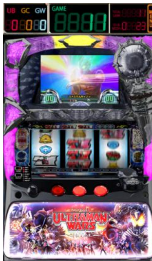
歴代のウルトラヒーローが活躍